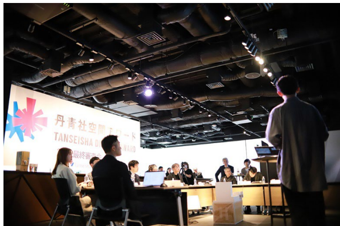
昨年のコンテストの最終審査会の様子

本アワードは、新たな才能と空間づくりのプロフェッショナルたちが出会い、そのポテンシャルやミライ空間の在り方を、ともに考える協創フィールドです。商業施設、小売店や飲食店等の丹青社のクライアントを審査員に迎え、丹青社のデザイナーらとともに、デザインやアイデア、可能性を多角的視点から審査することで、さまざまな方にこれからの空間づくりについて考える機会を創出します。